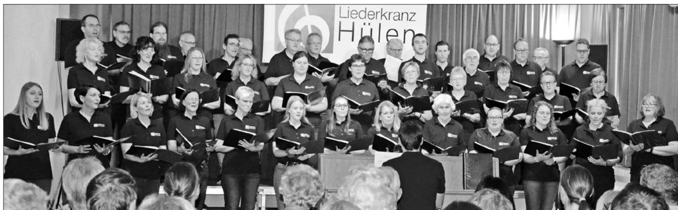
Der Liederkranz Hülen bot einen gelungenen Konzertabend.