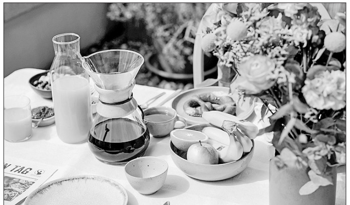
Wer fairan lebt, achtet auf faire und ökologische Zutaten und unterstützt so Menschen in Afrika, Lateinamerika und Asien, die die Zutaten für viele dieser Lieblingsprodukte anbauen.