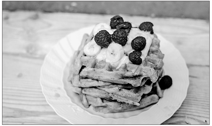
Die veganen Bananen-Zimt-Waffeln mit fair gehandelten Zutaten bereichern jeden Frühstückstisch.

Zubereitung: Das Waffeleisen vorheizen. Die Bananen mit einer Gabel zerdrücken und mit der Pflanzenmilch, etwas Agavendicksaft, Zimt und Kokosöl in einer Schüssel mit einem Schneebesen verrühren. Das Mehl hinzufügen und gut unterrühren. Weinsteinbackpulver und etwas Apfelessig dazugeben und wieder verrühren. Das Waffeleisen einfetten, den Teig portionsweise einfüllen und die Waffeln backen. Anschließend mit leckeren Toppings wie Joghurt, Ahornsirup, Bananenstücken oder anderen Früchten genießen.