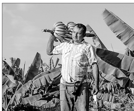
Fairtrade hat 2021 einen Grundlohn für Beschäftigte im Bananananbau eingeführt.