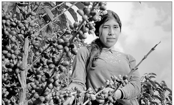
Mit Kaffee aus fairem Handel unterstützen Käufer Kleinbäuerinnen und -bauern in den Herkunftsländern.