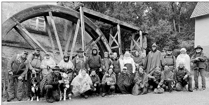
Die 28 stolzen Teilnehmerinnen und Teilnehmer der 3-Tages-Tour kurz vorm Ziel bei der Heroldsmühle