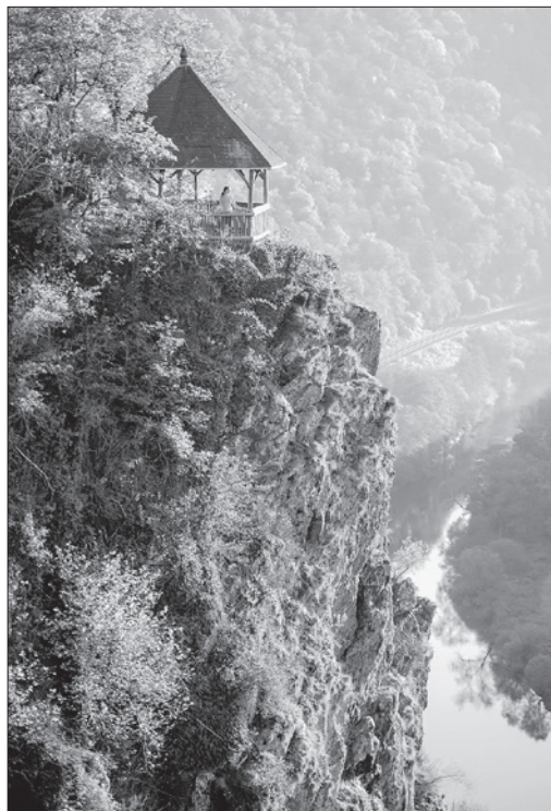
Zwischen Balduinstein und Obernhof fließt die Lahn in einer steilen Schlucht. Vom Aussichtspunkt „Gabelstein“ hat man einen atemberaubenden Ausblick auf die Lahn.