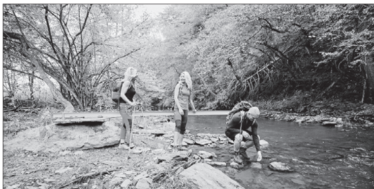
Eine wildromantische Wanderung entlang des Mühlbaches ist ein besonderes Naturerlebnis auf der „Vier-Täler-Tour“.