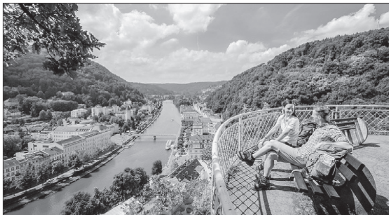
Einer der Höhepunkte am Lahnwanderweg: der Ausblick auf Bad Ems.

Am Bismarckturm über Bad Ems startet auch der vom Deutschen Wanderinstitut ausgezeichnete Premiumweg „Höhenluft“: Am Rundweg liegen spektakuläre Aussichtspunkte, antike Relikte aus der Römerzeit und die sagenhaften Heinzelmanshöhlen. Auf den Spuren einer weiteren Sage führt der Dörsbach-Mühlenweg von Katzenelnbogen nach Obernhof durch das Jammertal: Dessen Name erinnert an eine traurige Legende, die von erfrorenen Kindern erzählt. Von Nassau aus kann man auf der „Vier-Täler-Tour“ in fünfeinhalb Stunden bis nach Obernhof wandern: Durch stille Wälder geht es ins felsige Mühlbachtal, hinauf zum Kloster Arnstein und durch das einzige Weinbaugebiet an der Lahn. Oder man wählt in Nassau einen leichten, zweistündigen Rundweg auf dem Philosophenweg um den Burgberg im romantischen Mühlbachtal.