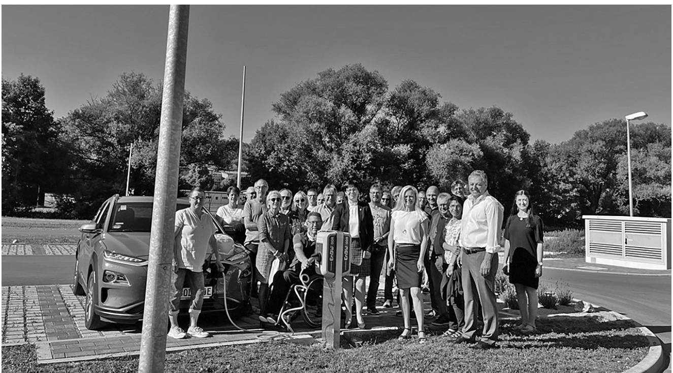
Vertreter der EnBW ODR AG, der Stadt Lauchheim, Mitglieder des Gemeinderates und des Klimaschutzbeirates