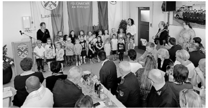
Liedbeiträge Katholischer Kindergarten St. Gangolf