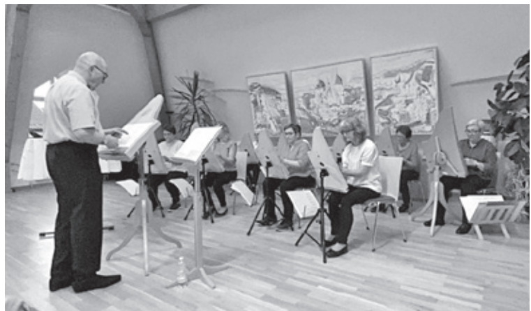
Konzert am 10.05.2022