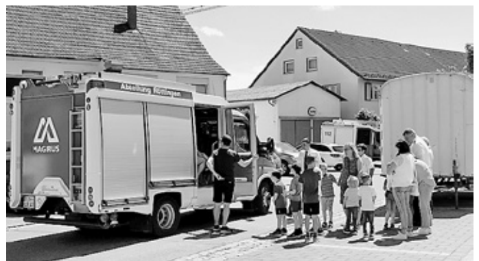
Rundfahrten mit dem Feuerwehrauto