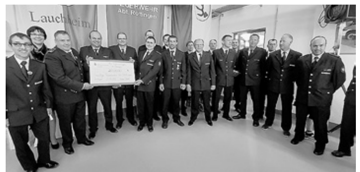
Scheckübergabe an die Freiwillige Feuerwehr Abt. Röttingen