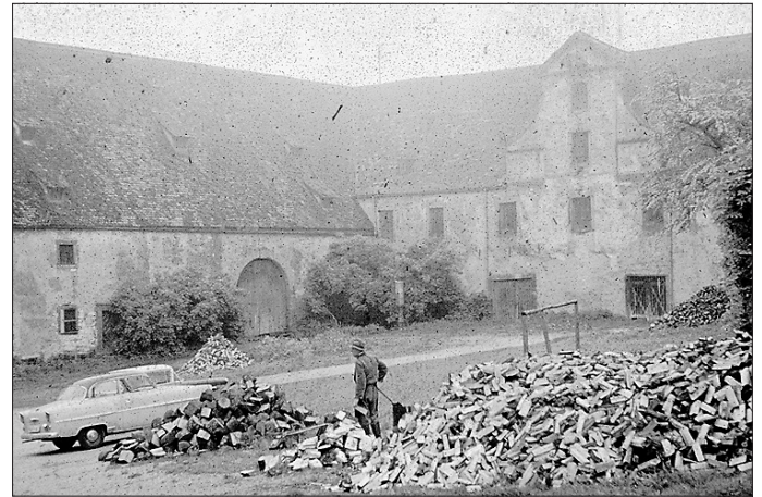
Herr Müller macht Holz – Blick in den unteren Schlosshof 1970.

Für Erwachsene kostet die öffentliche Führung 3,00 Euro, für Kinder und Jugendliche unter 16 Jahren 2,00 Euro. Nach aktuellem Stand gelten 3G.