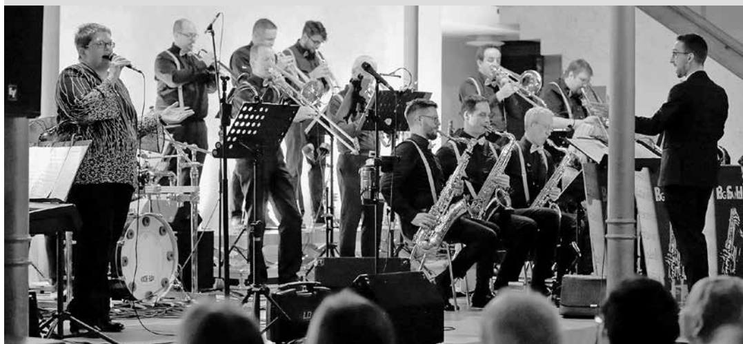
BSH Bigband aus Giengen

Samstag, 23. März 2024 um 20:00 Uhr, Alamannenhalle, Einlass 19:00 Uhr