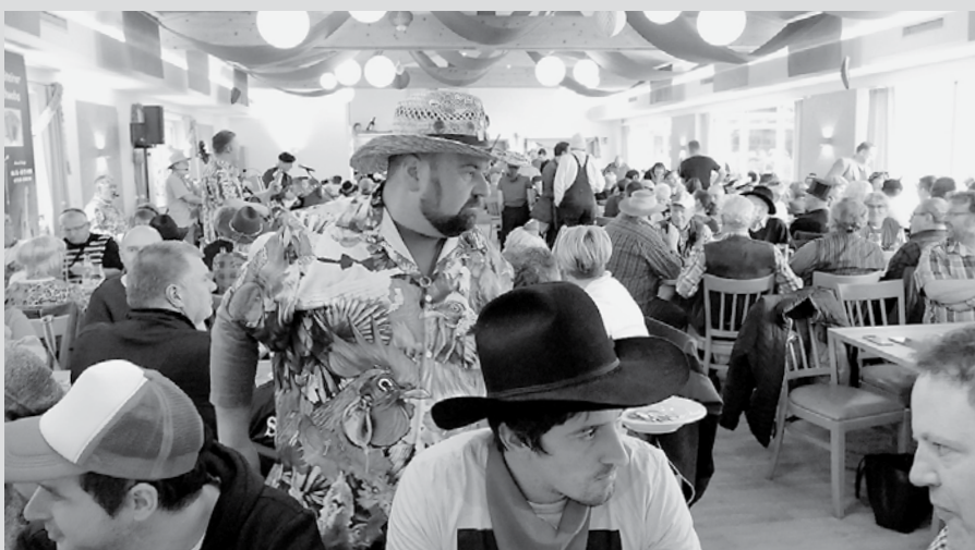
Beim traditionellen „Hunde- und Taubenmarkt“ werden nach Ausübung des alten städtischen Marktrechtes am Rosenmontag Kaninchen, Tauben und Hühner an die Meistbietenden verkauft.